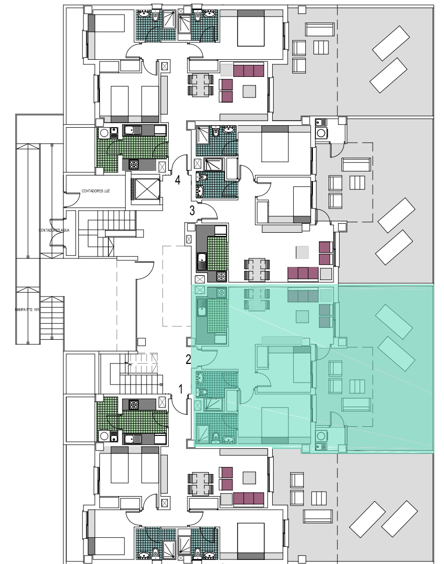
(PLANTA BAJA )